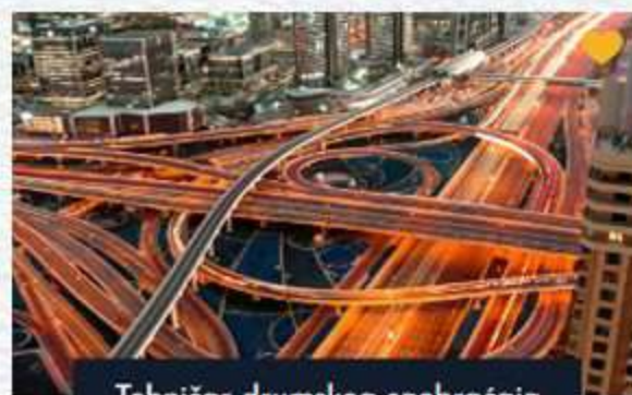
Tehničar drumskog saobraćaja

Osposobljavanje učenika za manipulaciju računarske opreme i sistema, kao i programiranje u raznim programskim jezicima