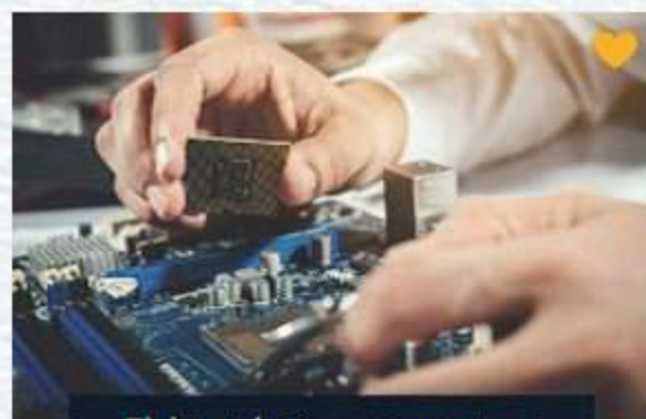
Elektrotehničar računarstva i informatike

Rad sa savremenim programskim jezicima. Dobra podloga za nastavak studiranja. Servisiranje računara